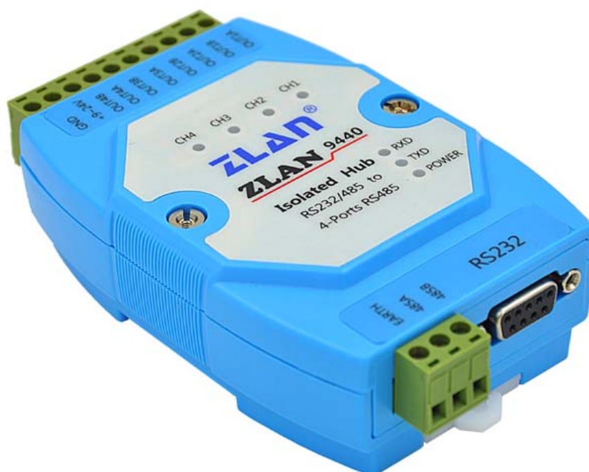
图 1 ZLAN9440 外观

如果只需要一路有源隔离型 RS232 转 RS485 则型号是 ZLAN9410。